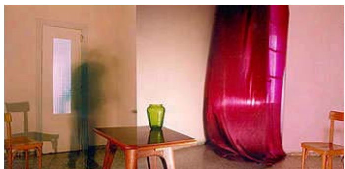
«Joya verde» (2000)