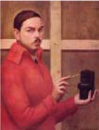
Angel Zárraga, Autorretrato, 1930/ Oleo sobre tela / 73 x 57 cm. [1886-1946]